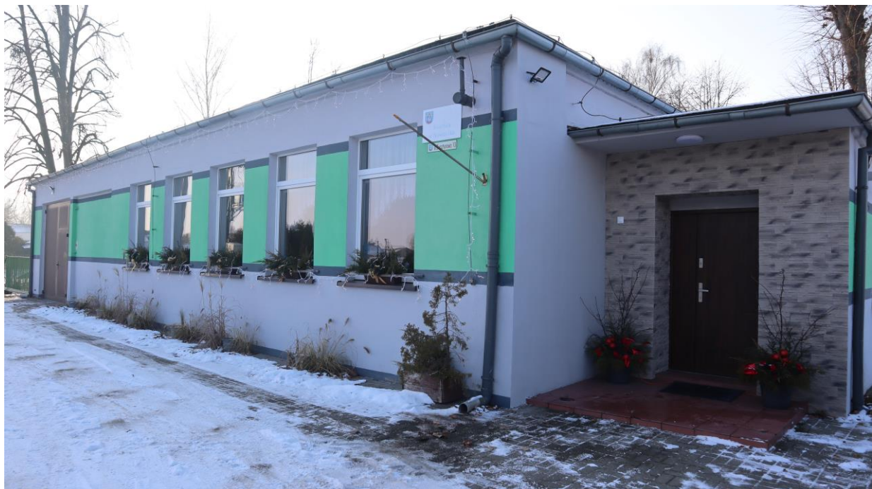
Świetlica wiejska w Nowieczku – centrum życia społecznego sołectwa.