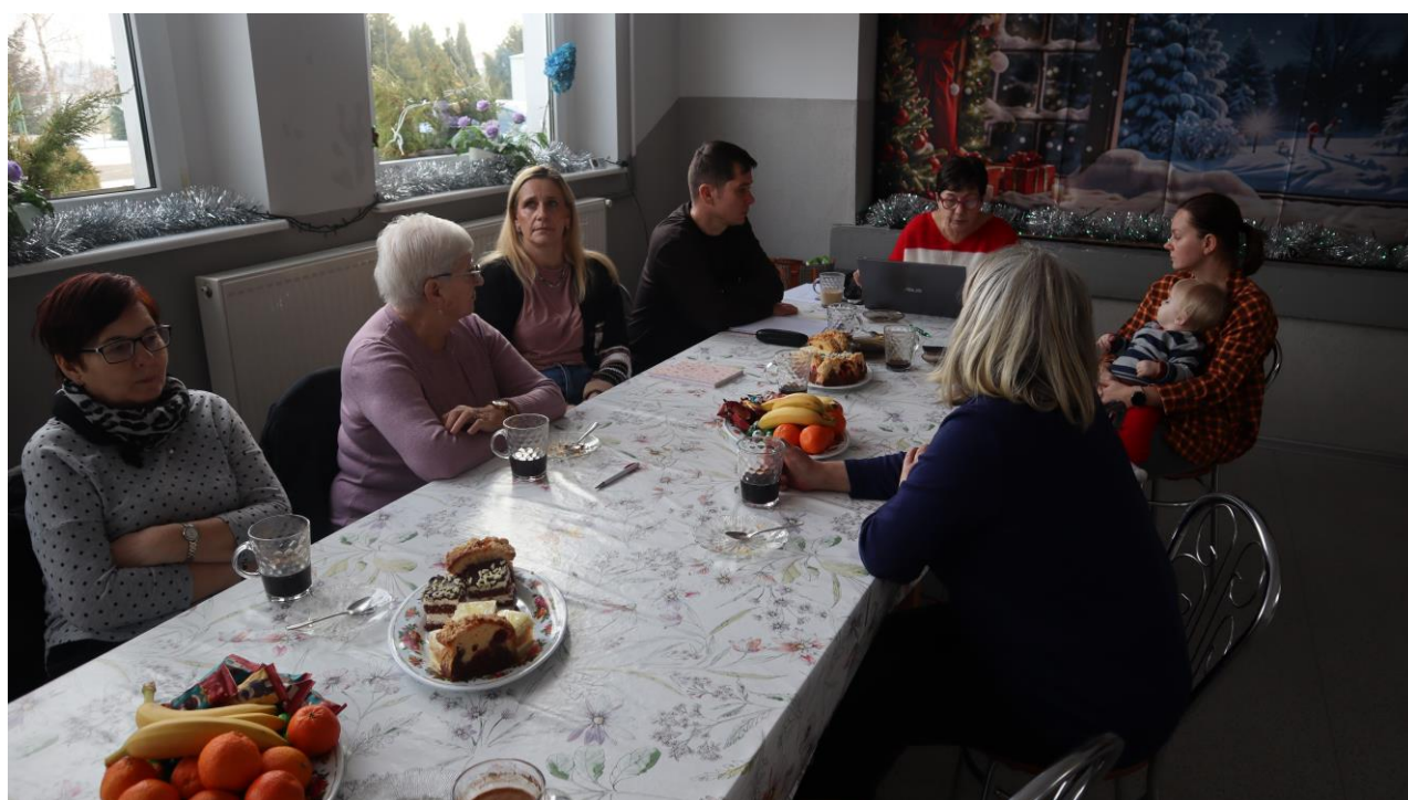
Grupa odnowy wsi w trakcie warsztatów.