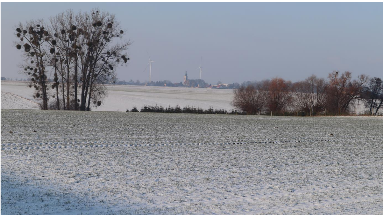
Wiejski krajobraz miejscowości – widok z ul. Diamentowej.