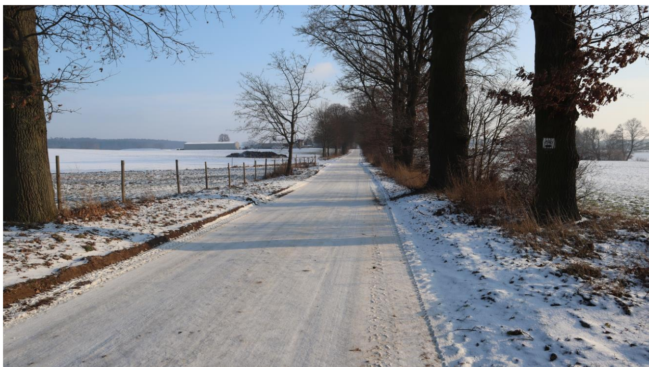
Infrastruktura drogowa w sołectwie – ul. Maliny z wyznaczoną trasą rowerową.