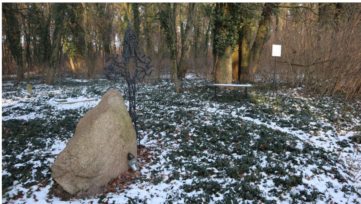
Cmentarz ewangelicko-augsburski w lesie.