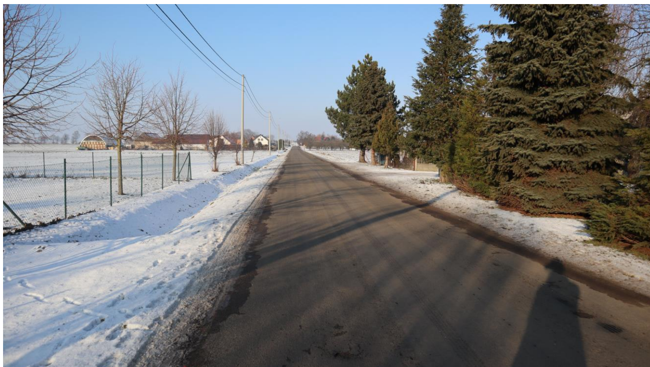
Infrastruktura drogowa w sołectwie – ul. Bursztynowa (droga powiatowa).