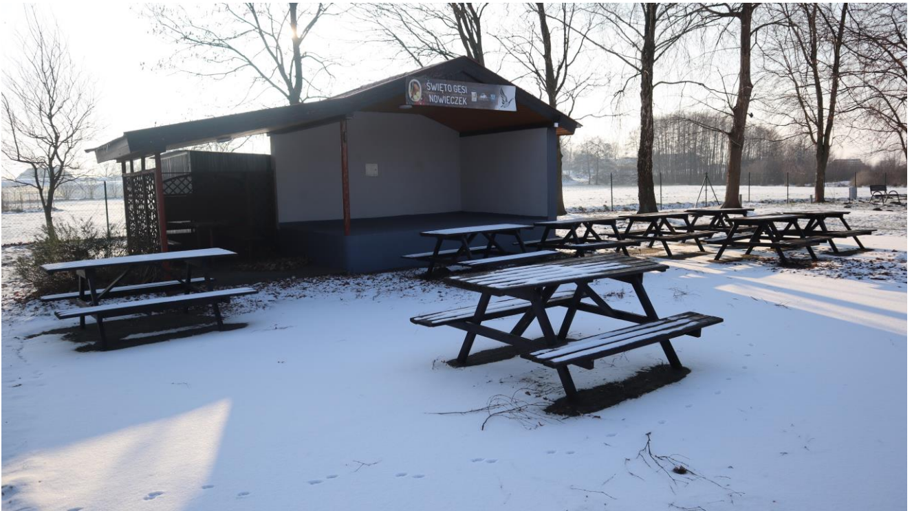
Teren rekreacyjno-sportowy za świetlicą wiejską.