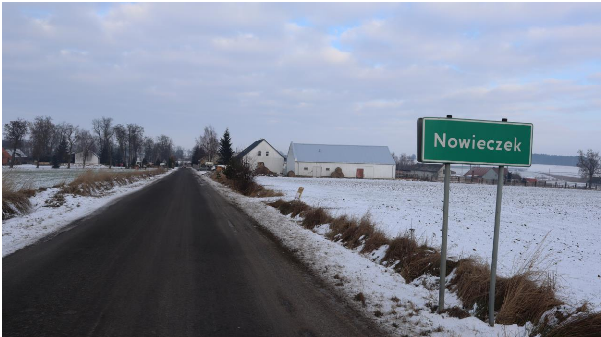
Wjazd do Nowieczek wraz z tablicą z nazwą miejscowości.