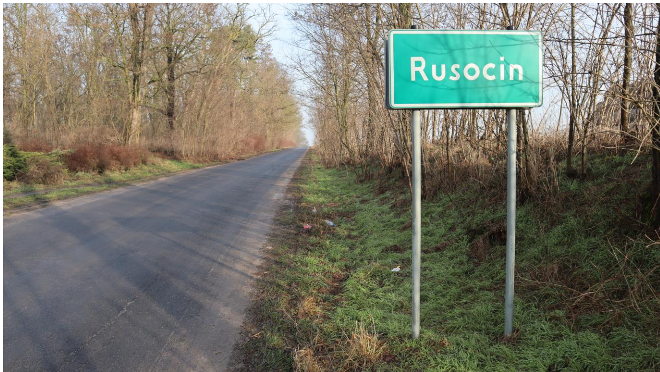
Tablica z nazwą miejscowości oraz widoczną infrastrukturą drogową (droga powiatowa).