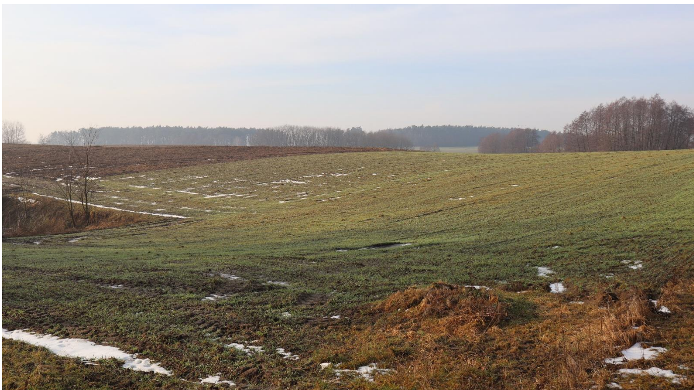
Widok na pola w Rusocinie przy wjeździe od strony zespołu dworskiego.