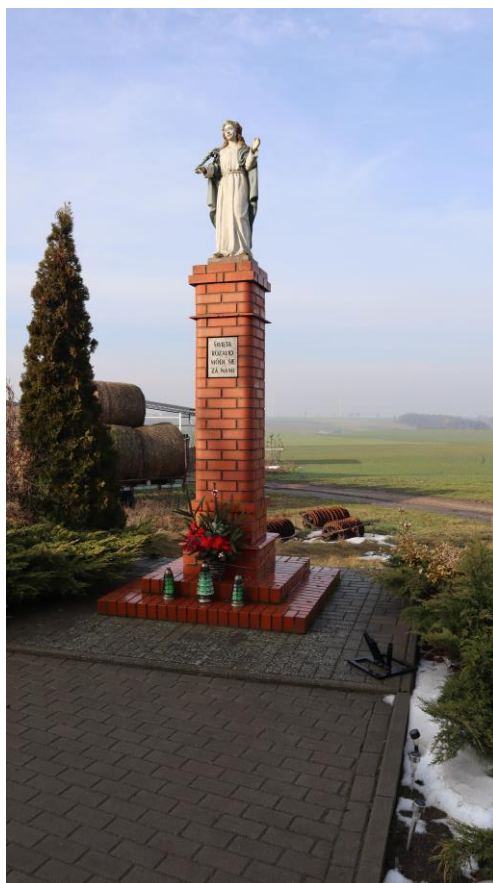
Figura św. Rozalii