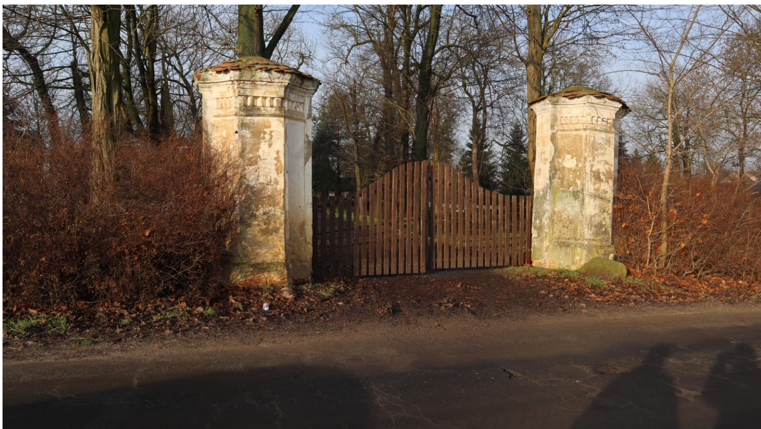
Zabytkowa brama prowadząca do zespołu dworsko-parkowego w Rusocinie (własność prywatna).