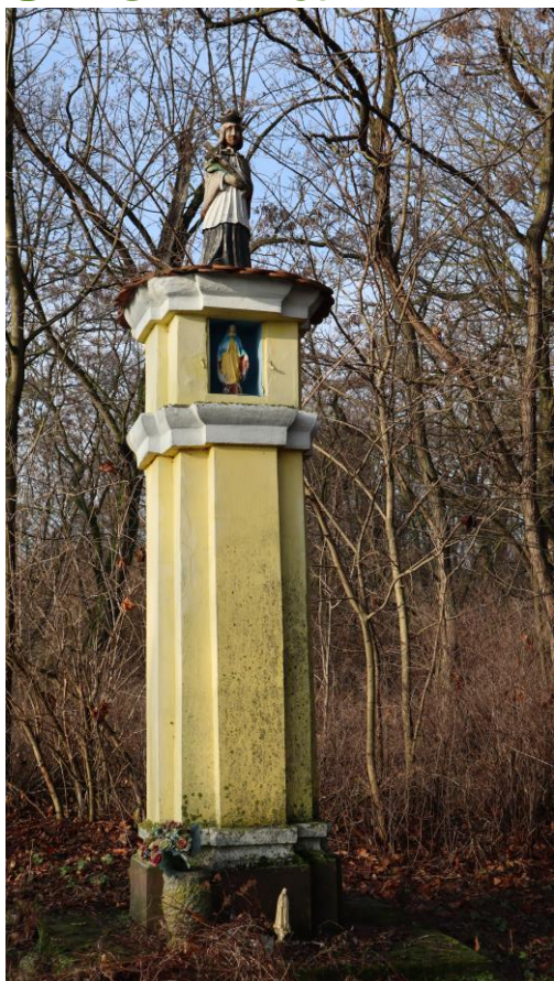
Figura św. Jana Nepomucena.