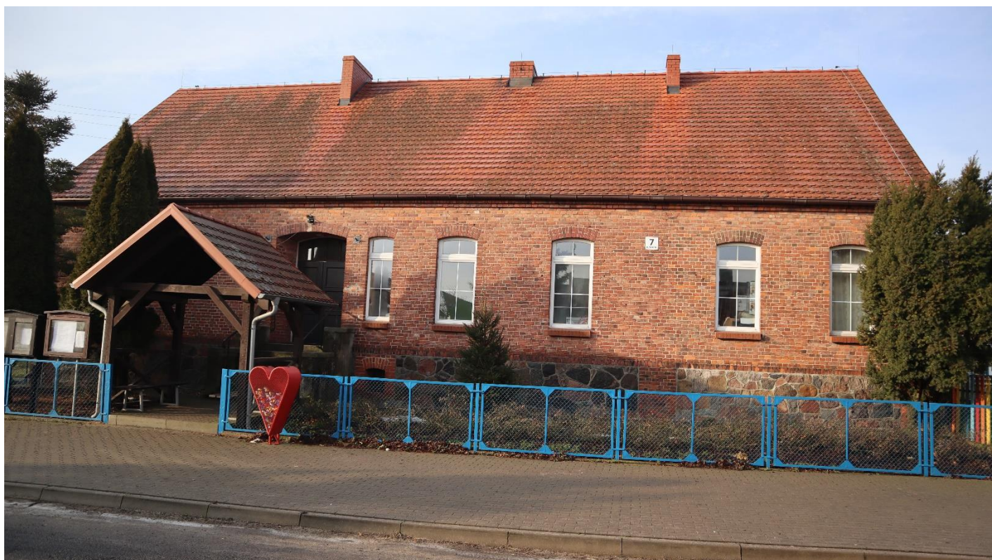
Świetlica wiejska w Rusocinie (dawny budynek szkoły).