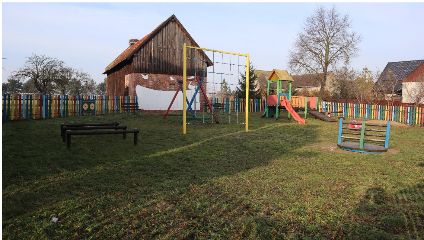
Plac zabaw i teren rekreacyjny obok świetlicy wiejskiej.