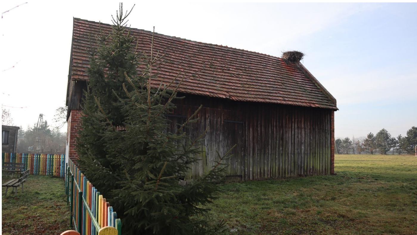
Stodoła i gniazdo bocianie przy świetlicy wiejskiej.