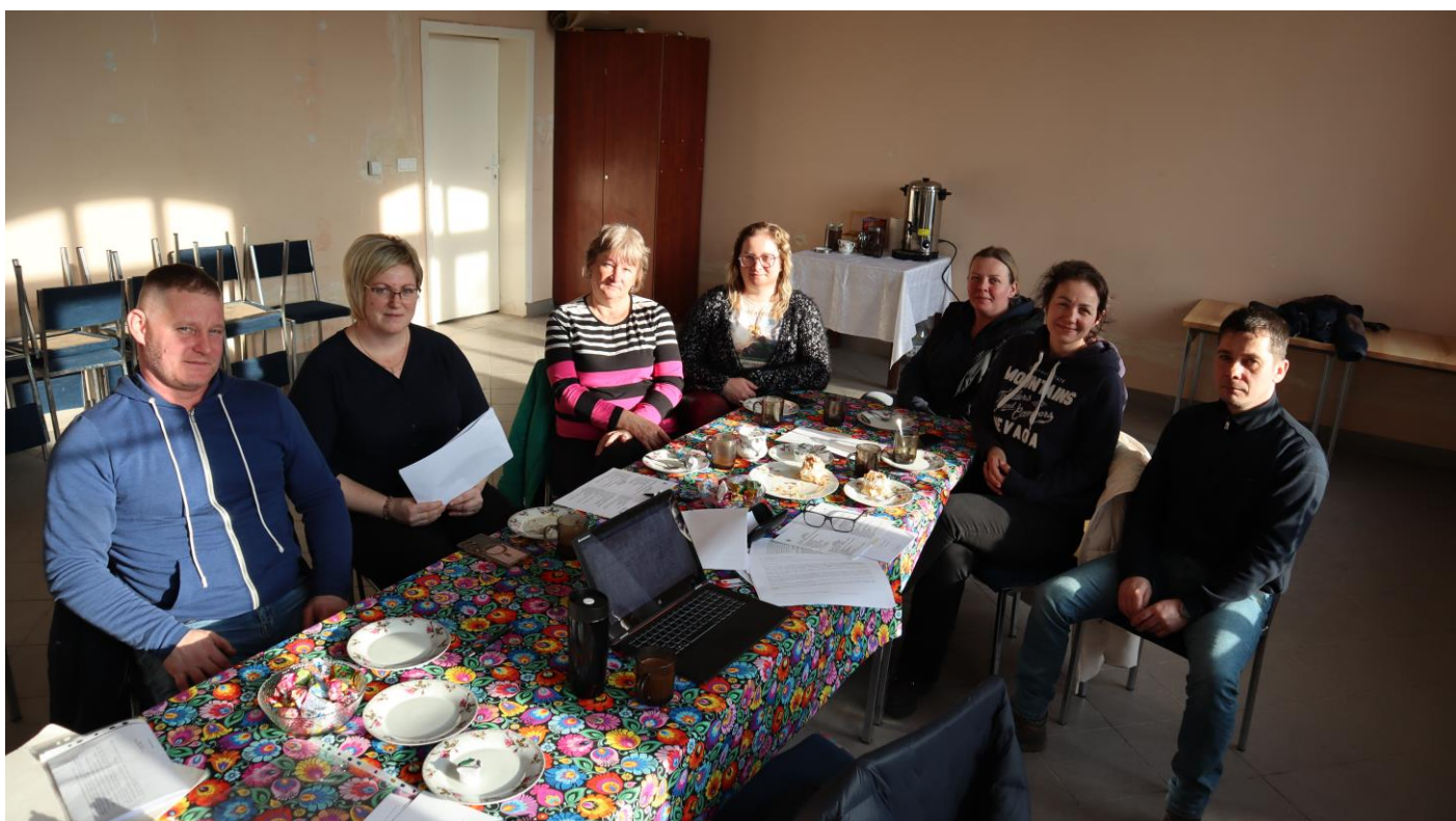
Grupa odnowy wsi Rusocin w trakcie prac warsztatowych nad strategią.