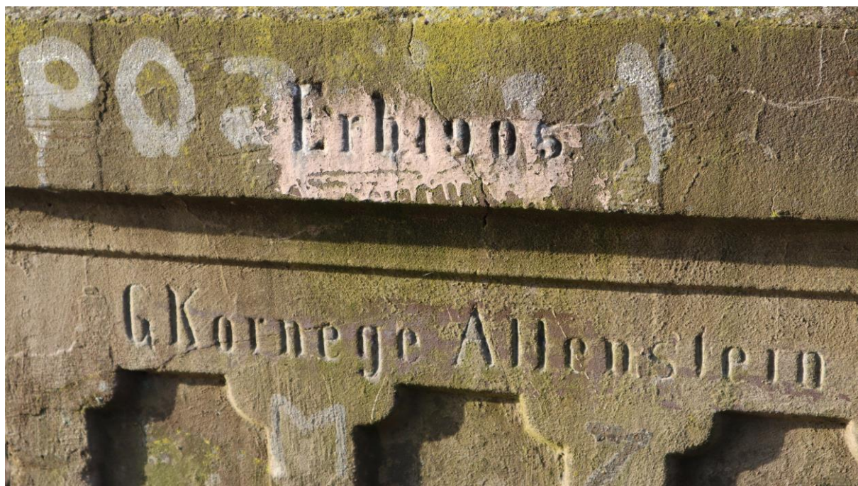
Żelbetowy most z 1905 r. nad nieczynną linią kolejową oraz niemieckie napisy na obiekcie.